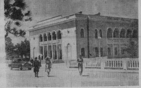
Абхазская АССР. В городе Гагаи закончено строительство районного Дома культуры. В нем имеется артистическая зала, библиотека-читальня и комната для кружковых занятий.

Особенно высокую производительность труда показывает бригада Надежды Усачевой. Она выполняет задание на 135 процентов и быстро осваивает