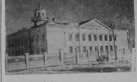
Виды трассы Волго-Донского судозащитного канала, где еще недавно была голая степь, выросли благоустроенные поселки строителей. На снимке: здание средней школы в одном из поселков строителей. Описание ТАСС.