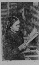
Уфа. Башкирское государственное хозяйство выпустило 1-й том сочинений И. В. Сталина на башкирском языке.

Данный об уборке урожая и хлебозаготовок по состоянию на 6 августа говорит, однако, что большинство колхозов не выполняют взятых на себя обязательств и далеко отстают от хлебозаготовок, ведут их только в крайнем случае. Особенно это можно сказать про колхозы им. Суворова, им. Мичуринца, им. Молотова, „Красный Пролетар“ и другие, сдавшие хлеб государству всего лишь от 10 до 100 процентов. Эти колхозы терпят кризис в косовые и допускают большой разрыв между скирвированием, обмолотом и хлебозащитой. Им особенно необходимо равняться на передовые колхозы, в них должна быть усилена полеводческая и воспитательная работа партийных организаций. Шире использовать на уборке урожая и хлебозаготовках опыт передовых колхозов, равняться по работе на колхоз „Большевик“ — условие, обеспечивающее успех уборочной, успех государственной поставки хлеба в государственные поставки.