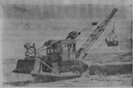
Сталинградгидроэлектростанция получает все новую и новую технику. Для строительных работ на правом берегу Волги иррегулярные агрегаты «Стал-1», выпущенные Колесским заводом. Эти универсальные агрегаты вытесняют работы бульдозера, трактора, грейдера, крана.

зав. секретаря парторг треста «Текстэкострой».