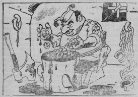
Франко: «Принято, когда моя работа покончена и несут». Рис. А. Евженина. Прессингесс ТАСС.