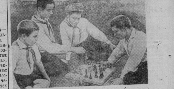
Пионерский лагерь стеклозавода им. Дзержинского. На снимке: пионеры за шашковой игрой.