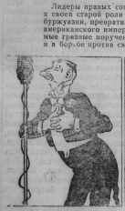
— Народ, тебе и... друг... Рис. Е. Шегалева.