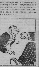
... а вам — покорный слуга! Прессинг ТАСС.