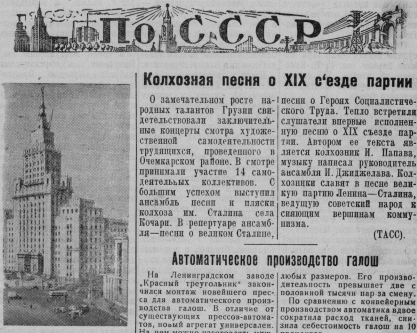
Москва. Строительство высотного здания министерства путей сообщения у Красных ворот.

Свои слова он подтвердил практическими делами. Об этом свидетельствует счет 1952 года, ономом металл и инструмент.