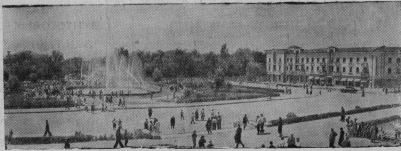
По городам и странам

Растет и благоустривается Сталинабад—столица Таджикистана. Ежегодно в городе появляются десятки новых жилых и культурно-бытовых зданий. На улицах и площадях высказываются тысячи деревьев и кустарников. Только в прошлом году на строительство и благоустройство Сталинабада израсходовано около 100 миллионов рублей.