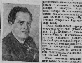
6 июня — 65 лет со дня рождения (1888) Валерия Владимировича Куйбышева, выдающегося деятеля коммунистической партии и Советского государства, одного из ближайших соратников В.И. Ленина и И.В. Сталина. В 1904 году, 16-летним юношей, В. В. Куйбышев вступает в Российскую социал-демократическую рабочую партию и сразу принимает в фракцию большевиков. В 1905 году он ведет революционную политику в период империалистической войны Куйбышев в качестве профес-