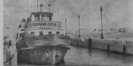
На Волго-Донском судолонном канале ивены В. И. Лежидя летит вторая навигация. В нынешнем году речники Волго-Донского пароходства должны перевезти грузы значительно больше, чем в прошлом году. На снимке: грузовой теплоход «Кудожник Серов» прохлдит через шлюз №6.

Коллектив Самаркандского завода «Квант» освоил производство усовершенствованной кинорадиостанции, предназначенной в основном для использования в колхозных клубах, домах отдыха, санаториях и школах. С помощью новой установки можно одновременно вести демонстрацию фильмов и трансляцию радиосредств. Приспособлена она и для передачи грамзаписи. Советский завод кинорадиостанция портативная, обслуживаемая одним человеком. (ТАСС).