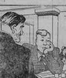
Здесь нас не столько кормят, сколько наше время съедает... Рис. К. Евсейца.

Нет ни столов, ни стульев. А как бы они украсили помещенье, внесли культуру!