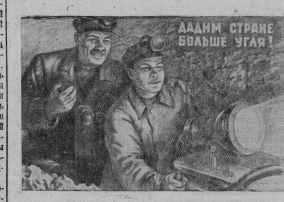
Плакат художника К. Крылова, выпущенный издательством «Искусство».

общей площадью 2,3 миллиона квадратных метров. Только в 1948—1952 годах для шахтеров построено около 2,400 различных социально-бытовых и культурных учреждений.