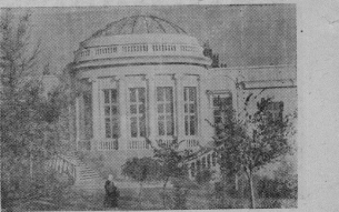
Крымская область. В Евпатории построена Центральная културная организация. На снимке: у здания подвизники.

♦ На парижском рынке в Базель-Лет (Швейцария), Лиссабон, Бельгия) на днях произошли серьезные кризисы. В результате взрыва полностью уничтожены из цехов завода и повреждены прилегающие к нему здания.