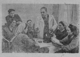
Дружеская встреча. Ученые Юрковского сельскохозяйственного института часто выезжают в колхозы, оказывают им помощь в борьбе за повышение урожайности сельскохозяйственных культур и увеличение продуктивности общественного животноводства.