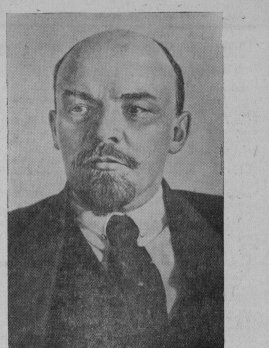
В. И. Ленин.

Одним из важнейших условий победоносного строительства коммунизма является дальновидная твердость Советского государства, партия осуществившая построение социализма в нашей стране, подготовившая нашу Родину к активной