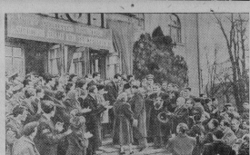
Названо в Венгерской Народной Республике, которое на гастролях артели «Красный петушок» в труппе СССР. Советские артисты дали высокохудожественные, хорошие представления в большом успехе.