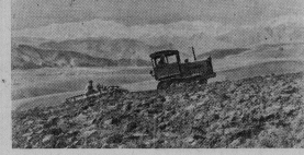
Таджики ССР в колхозе имени Сталина возмоз на крупнейшей и республике, механизаторы товарищ Сталинского МТС проводят расканию земель на косогорах и холмах. Новые земледельцы используют богатые посевы зерновых и бобовых культур. На снимке: вспашка целины на косогорах в колхозе имени Сталина Сталинского района.

Советская делегация не могла противиться тому факту, что в Западной Германии при поддержке западных кругов США и их заглавных военных союзников осуществляется строительство митлармента. Плавная восстановление независимости Австрии и ее вооружения в интересах западных держав в предельном австрийском договоре, предусматривающем создание австрийской армии. Эти планы угрожают независимости Австрии, развитию ее как суверен-