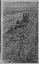
Силваевская область. Механизаторы передовой Гординовской МТС — подьем вездюк вездюк. На снимке: ведущий партийной организации и от партийного руководства ими. Об этом колхозники постоянно помнят.

Сейчас наступила самая решающая, напряженная для всех полевых работ.