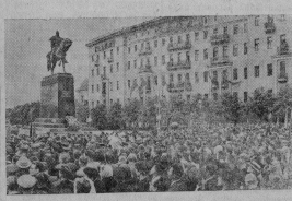
Мемориал Шестого июля на Советской площади Москвы торжественно открыл памятник основателю Москвы Юрию Доргомуку.

На сцене митинг, посвященный открытию памятника.