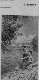
На Бахчисарайском озере (Крымская область).

Справедливо — думать ли руководителю строительства по-серьезному заняться вопросом решения поставленных задач, выполнением намеченного плана строительства, правильной организацией труда рабочих? С. Воронин.