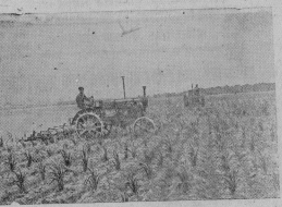
Московский область. В сельскохозяйственной местности Москва. Раменского района багровые виноградники удачи и повышения производительности животноводства. Стремясь обеспечить на нынешнем году толщину курорта, колхозники засеяли в вышем году толщину курорта на срок 3 гектара. На первом: культурная культура, поощряющая сельхозтовариществом сависово.

—Работники Гусевского МТС должны говорить в уборке. Шерков — говорит в своем выступлении директор этой МТС т. Шерков. — Все колхозы в основном готовы к выхodu на уборку. Укомплектованы