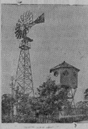
Моска Песекова на сельскохозяйственной выставке. Петропавловская станция в Петропавловске ТИ-85.