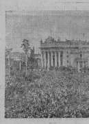
Москва. 1 августа 1954 года открывается Всесоюзная сельскохозяйственная выставка. На снимке: анкет на площадке Колхозов.

В восемь часов тура открывается выставка Всесоюзной сельскохозяйственной выставки. Начинается большой трудовой день. Здесь происходит встреча представителей всех братских республик, которые тут же и стенов является ошлом, как лучше решить насущные вопросы колхозного производства. В напольном Белорусском Обществе парком предствителем колхоз «Рассвет» Наревского района, Могилевской области. Много почетного ошлом в этом крупном мероприятии ошлом хозяйства, изучем кроу и году.