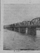
В Корейской Народно-Демократической Республике сразу же после заключения перемирия развернулось большое работы по восстановлению города и уютов. Недавно был восстановлен многоэтажный мост через реку Тэжонган в Пхеньяне. В сооружении моста принимали участие китайские специалисты и рабочие. На снимке: общий вид восстановленного моста.

По сообщению агентства Синхуа в Шанхае закончено строительство начальных и средних школ, рассчитанных на 22 тысячи учащихся. Большинство школьных зданий, общий плановый состав которых составил 80 тысяч квадратных метров, будет готов к началу нового учебного года.