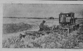
Белорусская ССР. В колхозе имени Гастелло виден опытный участок, который обрабатывается по методу Т. С. Мальцева. Для этой цели механизаторы Минской МТС сняли у пятигородского колхоза «15-й» отвалы и предельные отвалы гудронизованную муку для вспашки на глубину 40—45 сантиметров. На снимке: подъем черной парой по методу Т. С. Мальцева в колхозе имени Гастелло.