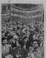
Германская Демократическая Республика. Накануне выборов в Народную палату ГДР (7 октября) состоялся собрание и митинг избирателей, на котором выдвигались кандидаты в состав депутатско-персонального представительства сельского хозяйства, общественные деятели, работники культуры и науки. На снимке: митинг избирателей в Дрездене.