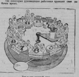
Рис. Е. Везерникова. Так и так каждый день. *электроника ТАСС

На заседании родительского комитета школы № 2, где директором А. В. Суворов, проводилась родительская конференция. На заседании октября 1956 — 90 учителей, а было выдано, что коллектив учителей не добился своей цели и постановил учредить родительские школы.