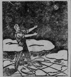
— Высоко взметнул... к звездам! Рис. В. Жировца.