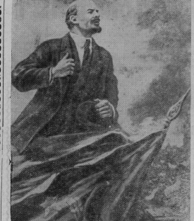
В. И. Ленин на трибуне. С картины художника А. Грбанова.

В это время с фронта были отозваны 3 эскадроны военных аэвланов, которые должны были испсти Россию.