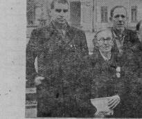
Недавно коммунисты нашего города подали эггет своей деятельности за минувший год. В работе партийной конференции приняли участие старейшие коммунисты и первые члены Совета молодежи города, которых мы видим на этом снимке. Им, непосредственным участникам революционной борьбы, посвящается этот шарфик створ, перенесшим немало невзгод и тяжелых дней становления родной Советской власти, особенно приятно, глядящему на пройденный нашей страной путь за 40 лет.

И как не гордиться тем, что победо, одержанная четыре десятилетия назад советскими на-