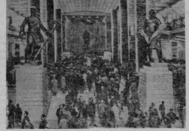
Экспозиция выставки в Брюсселе. В советском павильоне в день открытия выставки.