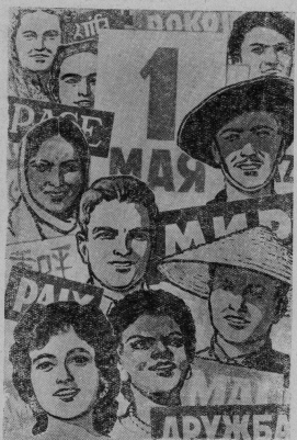
Плакат работы художника А. Коворкина (Государственное издательство изобразительного искусства).

Самым большим достижением коллектива является то, что ко дню 85-летия со дня рождения основателя нашей Коммунистической партии и Советского го-