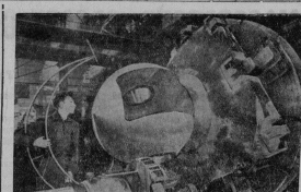
Свердловск. На Уралмашзаводе создается новый мощный шагающий экскаватор ЭШ125/100 с комбобъемом 25 кубометров. При первоначальном испытании экскаватор будет трудиться в условиях парирования грунта. Каждый опорный башмак у него сможет прижимать до 10 кубов грунта. Это стало возможным благодаря применению опорных шарового типа, разработанных инженерами завода. Каждая из двух шаровых опор диаметром 1400 миллиметров будет принимать на себя усилие в 1250 тонн. На станке лучшей токарки шела кручных узлов Уралмашзавода студент-заочник 2-го курса Уральского политехнического института В. М. Шенни обрабатывает поверхность шаровой опоры башмака 25-кубового шагающего экскаватора.