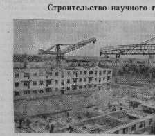
В Советском городе Новосибирск нового города Сибирского отделения Академии наук на площади 1200 гектаров Иван Александрович СССР. Здесь развернулось строительство жилищ. Будут сооружены четырнадцать

Советский народ, говорится в тезисах, слаленный вперед своей Коммунистической партией, достиг таких вершин, существования стало производящим преобразование, которые дали возможность нашей стране вступить теперь в новый важнейший период своего развития — период развернутой строительства коммунистического общества. Главными задачами этого периода будут задачи всестороннего создания материально-технической базы коммунизма, дальнейшего укрепления экономической и оборонной мощи нашей Родины и одновременно все более полного удовлетворения растущих материальных и духовных потребностей советского народа. Это будет решающий этап соревнования с капиталистическим миром, когда практическая задача быть выходящая историческая задача — думать и передать наиболее передовые капиталистические страны по производству продукции на душу населения. Коммунистичес-