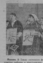
Являясь в Токио составитель фильма, песни, в котором приняли участие рабочие и крестьяне японских коллективов. Они выдвинули песни, посвященные борьбе за мир и лучшее житье.

На снимке: выступление японских артистов.