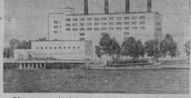
Объединенная Арабская Республика. В Египетском районе ОАР — члены делегации. Худож. оформление — члены делегации. На снимке: общий вид делегации. Центральный

НА 28 МАРТА. 17.40 — Для детей. Л. Гераскина. «Телевизионная постановка. 19.00 — Последние известия. 19.15 — В Гусеве состоится совещание работников Государственного академического Малого театра. 21.35 — Новостной фильм «Наша жизнь». 21.45 — Наш клуб.