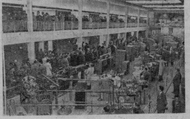
Москва. В Центральном парке культуры и отдыха имени М. Горького открыта Польшая промышленная выставка. На сессии посетители осматривают выставку.