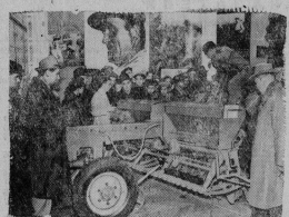
Москва. В одном из крупных павильонов ВДНХ открыта юбилейная выставка «10 лет Германской Демократической Республики, организованная ГДР. Многоотраслевые экспонаты демонстрируют успехи экономики, науки, культуры ГДР. На снимке: в отделе сельскохозяйственной техники