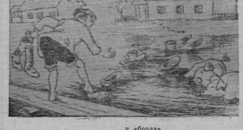
Рис. И. Сачева.