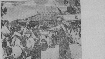
Корейская Народно-Демократическая Республика. На солесом празднике.

НЬЮ-Йорк. (ТАСС). Дипломатический обозреватель газетного объединения «Спарк» — Говард Шаферд пишет, что «примирения Хрущева по таким вопросам, как разоружение, колониализм и т.д., больше привлекают внимание представителей азиатско-африканской группы, чем примамы Соединенных Штатов». Говора о падении влияния американско-азиатского блока в ООН, Шаферд, в частности, указывает, что западной машине голосования удалось не допустить включения в повестку дня сессии Генеральной Ассамблеи ООН вопроса о предоставлении места представителям Китайской Народной Республики лишь «скамьям незначительного большинства».