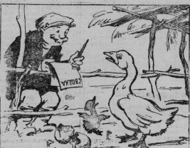
Записки: «Поголовье птиц в колхозе увеличилось вдвое!» Рис. М. Ушаев.

В колхозе им. А. Горького (председатель тов. Титов) на 1 января 1960 года числится около 50 голов. За год они увеличились в два раза. Если и вконец такими темпами развивать птицеводство, то колхозу потребуются 100 лет, чтобы создать такую же ферму, как в колхозе «Большевик».