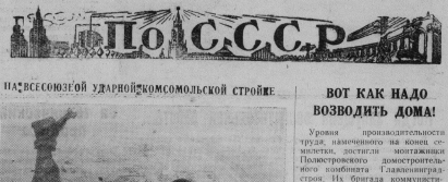
НА ВСЕСОЮЗНОМ УДАРНИКОМ СОМОЛСКОЙ СТРОИТЕ

Одновременно колхоз «Большаяныя» приступил к продаже государству скота и шерсти. Сейчас ежедневно на площадке от курсеских собирается по 1000 штук ян, которые полностью сдаются государству.