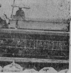
В Восточной Грузии — Кавкати идет сев. зимы. Организовано начало работы в колхозе села Мтавари Сигнальского района Полюсом вблизи обязательство получить по 22 центнера зерна в среднем с гектара.