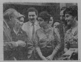
Москва. Второй Международный кинофестиваль. На сцене — у костюмированных «Меланж». Сцена правого кинорежиссера Григорий Эрлер, кинорежиссер Фрида Нисенбаум.