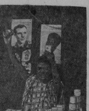
Бейрут, Ливан. Уголочки из города Корифора Уманья им Амюна со стороны лучшей стороны — против колоннато Ю. Гагарина.

В Москве закончилась 24-я Международная конференция по вопросам просвещения, созванная по инициативе ЮНЕСКО и Международного бюро по вопросам просвещения.