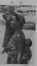
Республика Гана. Так во многих странах Африки материк посетил своих детей.