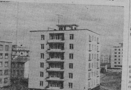
Ленинград. Впервые произведены газобетонные детали и монтаж в них жилых домов в городе был освоена Автокомсом строительным комбинатом. Изготовленные детали заводом строителям получил широкое распространение. Четыре типа таких домов разрабатывает фабрика № 1 «Ленинград».

На снимке: ансамбль домов из газобетона по Южному району.