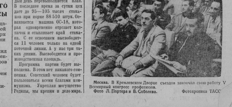
МОСКВА. В Кремлевском Дворце съездов закончилась первая работа V Зимний конгресс профсоюзов.

Единодушно принято письмо Центральному Комитету КПСС.