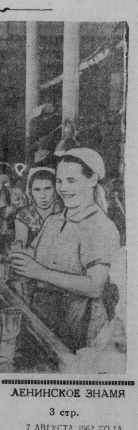
ЛЕГИНСКОЕ ЗНАМЯ 3 стр. 7 АВГУСТА 1962 ГОДА

С вступлением в строй поточной линии Курловского района заводу удалось повысить культуру производства, обмундировать ряд рабочих. Стоимость в настоящее время