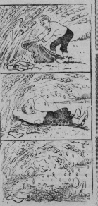
Случай и неравным производительности молока.

Важным шагом в осуществлении плана по переводу коров на машинное доение является внедрение машинного доения коров в совхозах и колхозах. В этом отношении особенно успешно работают хозяйства Муромского и Кировского производственных управлений. В этих хозяйствах достигнуты высокие результаты по переводу коров на машинное доение. В частности, в совхозе им. Калинина Владимировского производственного управления достигнуты высокие результаты по переводу коров на машинное доение. В этом отношении особенно успешно работают хозяйства Муромского и Кировского производственных управлений.