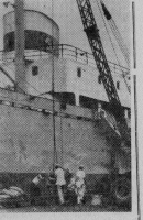
Полтава экономическая партия революционной Кубы, объявленная Союзом коммунистических партий Америки, которую мы поддерживаем. В кубинские порты привозит грузы из Советского Союза и других стран социализма. Многие коммунистические организации — Канада, Швеция, Италия, Япония, Мексика, Уганды и другие страны Вьетнама требуют освобождения Кубы от американской оккупации.