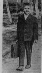
В первый класс.