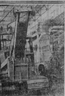
На снимке — с рабочими в сборочном цехе.

В прошлом году, несмотря на осеннюю зябь, в валках хлеба по плану урожай картофеля по 79 центнеров с гектара, овощей — по 175 центнеров. Государству продано 143,6 тонны картофеля, около 146 тысяч тонн. Ужелье переработано в муку. Ужелье государство за проданное животноводческих продуктов.