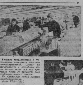
Большой популярностью в Чехословакии пользуются моделизм и авиомоделирование. Сейчас их изготавливают и выпускают более десяти тысяч и в них работает почти 80 процентов всех профессиональных технологов.

На снимке: нуд практические занятия в механическом техникуме (София).