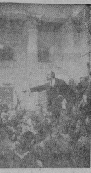
В. И. Ленин провозглашает Советскую власть (с картины художника В. Серова).

В подготовке к 50-летию колхозов говорится, что им награждаются юности и девушки, «показывающие пример юности своего отношения к труду, активно участвующие в пропаганде и выношении государственной науки и передовой практики». В таких случаях могут быть не только колхозники и работники совхозов, но и агрономы, инженеры, учителя, работники на селе, рабочие заводов сельскохозяйственного машиностроения, строители жилищно-коммунальных объектов, студенты и учащиеся, ознаменовавшие себя большой шестью помочь колхозам.