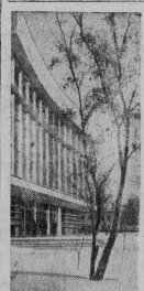
В Сергеево построено новое здание драматического театра имени Карла Маркса (на снимке со стрелкой). Здание по проекту архитектора М. С. 1966 года.