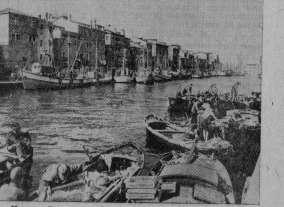
Итали. Венеция — один из красивейших городов мира, по... (текст частично нечитаем)

Отсутствие во втором туре... (текст частично нечитаем)