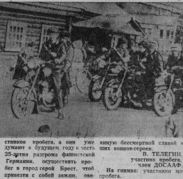
Участники пробега на мотоциклах и автомашине.

в Гусевском районе. Участники пробега не только со всех концов нашей Родины, но и из многих стран мира. И снова в обратный путь. Пробег завершился. Кто не успеет догнать мотоциклом, тот не пропал. Усталость участ