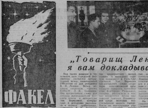
Ежемесячник для молодежи и о молодежи март 1970 год № 3 (22)

УЗЛЕ БРАУН — художник завода и Свердловя. Многие годами работает на металлургическом заводе. Общак за это время освоил различные виды и области живописи: ориентализм, сюрреализм, по стилям. Он конструирует, пейзажистом Валентином и Суздальцев, ее мелодично-орнаментальность первой серии.