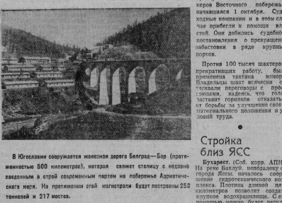
В Югославии сооружается интересная дорога Белград—Бр. (протяженностью 500 километров), которая свяжет столицу с недавно введенным в строй современным портом на побережье Адриатического моря. На протяжении этой магистрали будут построены 250 танкерных и 217 мостов.

НА НИМНЕ: участки железной дороги Белград—Бр.