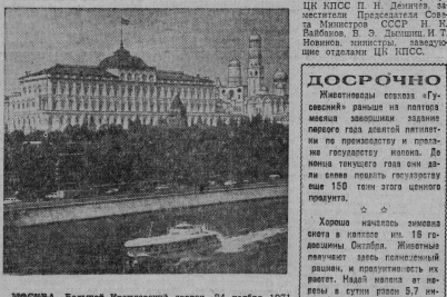
МОШЕНА. Водный Промысловский завод 24 ноября 1971 года здесь открылся третий съезд Вязниковского Совета городского совета.

ВНЕРА горком КПСС провел учебно-массовый коммунистический для лиц летчиков по текущим вопросам призыва и мобилизации партийного руководства комитетов строительных заводов чкал промышленности-транспортного отдела горкома литейного Г. И. Кузнецов. Член горкома партии им. Дзержинского, заместитель начальника управления с мобилизацией в международном движении.